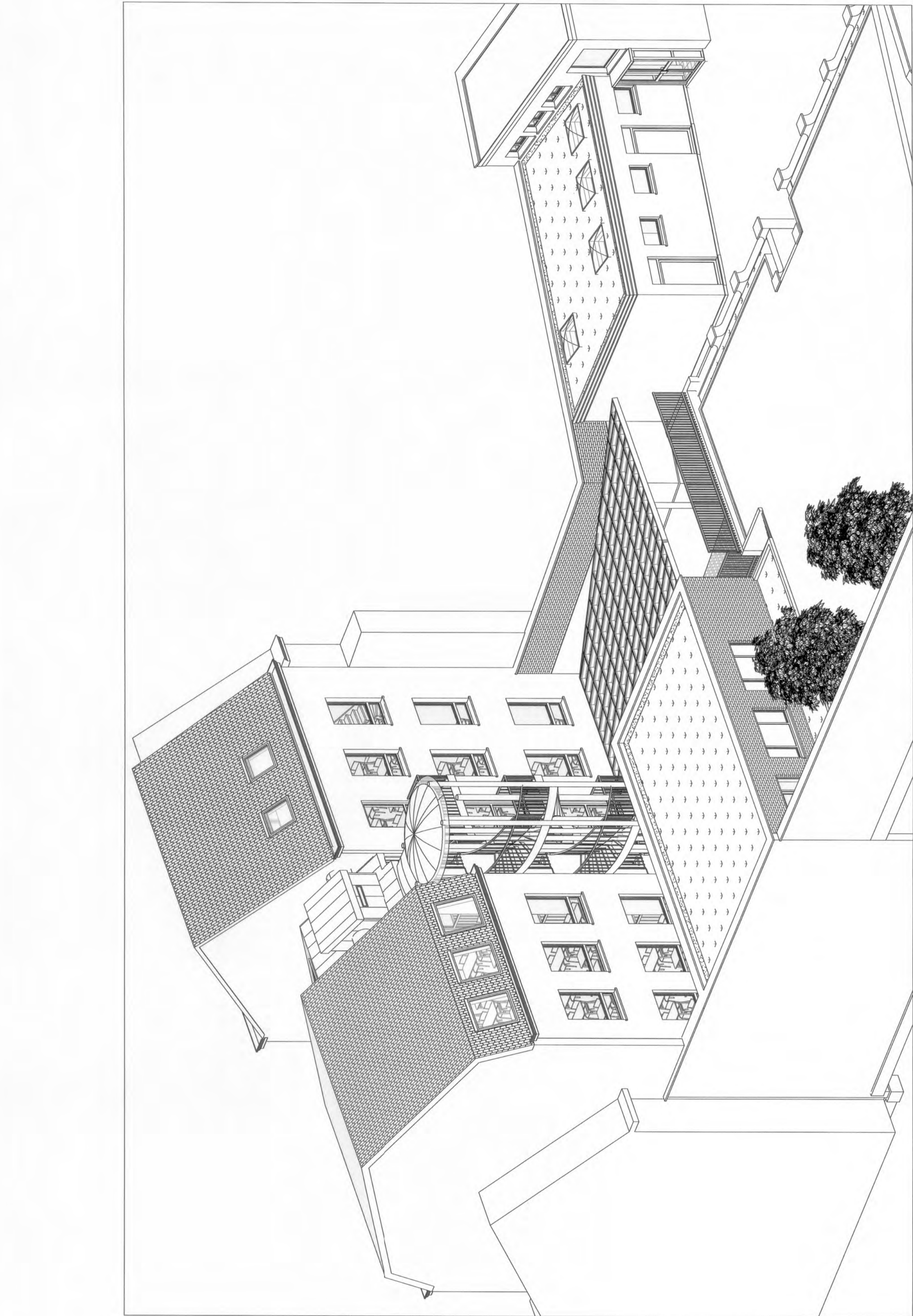
3D - ARRIÈRE GAUCHE